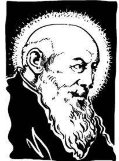
KONRAD VON PARZHAM

Am 22. April 2007 feiern wir in Eittingermoos das Patrozinium. Um 8.30 Uhr startet an der Pfarrkirche St. Lantpert der Bittgang. Die Heilige Messe feiern wir in der Filialkirche St. Bruder Konrad um 10.00 Uhr.